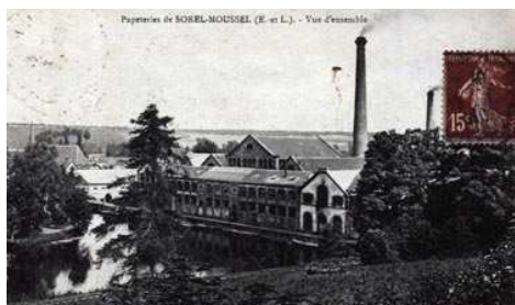
Anciennes papeteries Firmin-Didot à Sorel-Moussel.