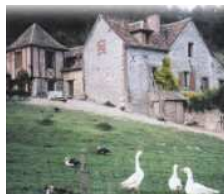
Ferme Auberge de la Côte Blanche à Ezy-sur-Eure.

Itinéraire Chartres-Guainville : N 154 Dreux D 928 Anet D 933 D 115 Guainville.