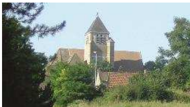
Forteresse et église de Guainville.